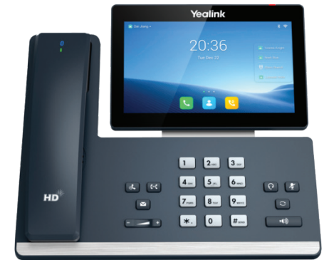
*תוספת מצלמה לדגם Yealink SIP-T58W Pro